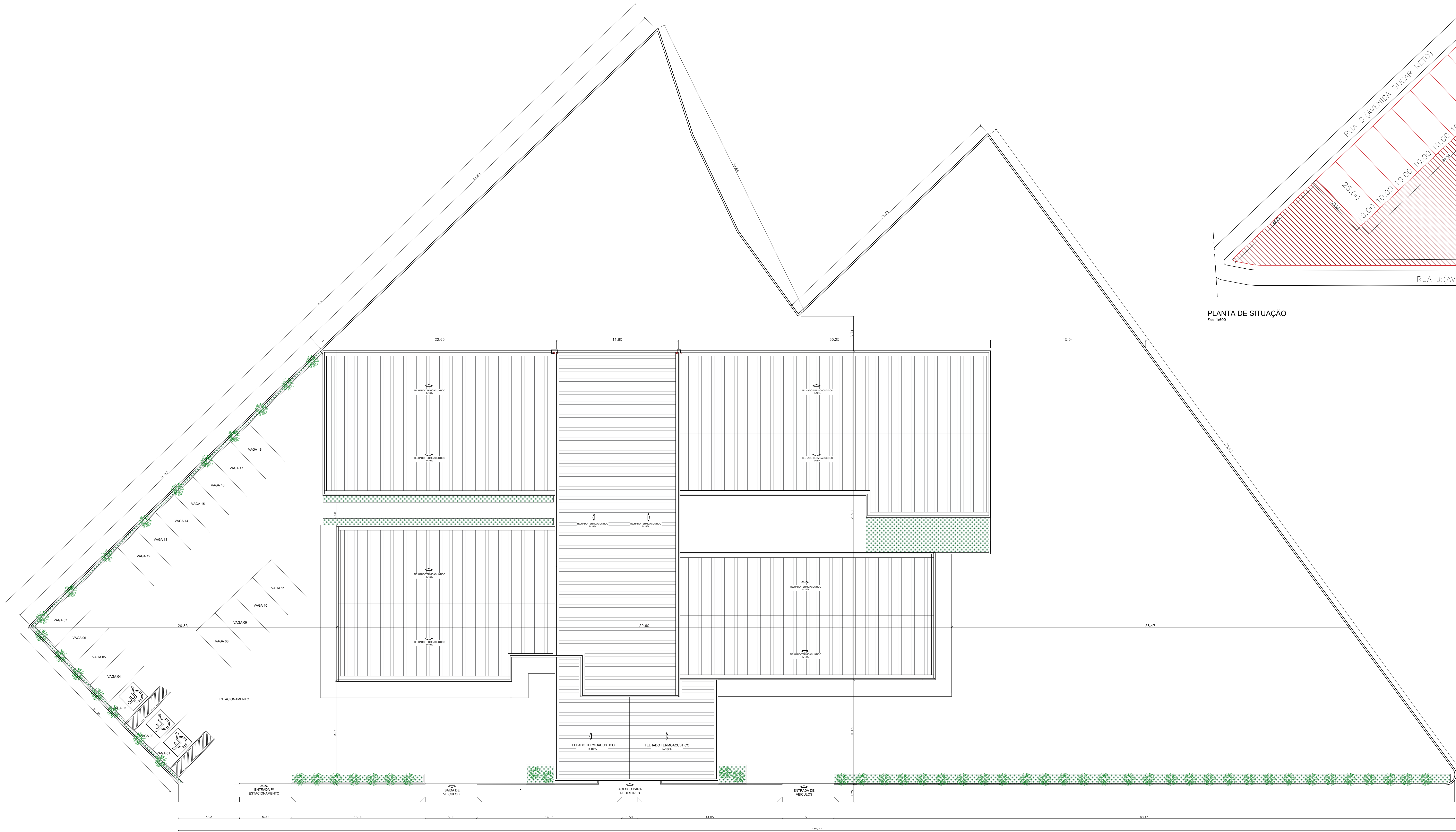
PLANTA DE IMPLANTAÇÃO Em 1:100